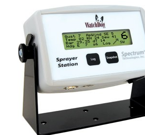
Console di lettura e memorizzazione

La stazione viene fornita completa di sostegno magnetico, console di visualizzazione e memorizzazione delle letture, software e 7 metri di cavo per i connettori seriali e di alimentazione. Al posto della console, è anche disponibile una versione con software di lettura e downloading per PDA. In questo caso è tuttavia opportuno tenere in considerazione le esigenze di memoria della notevole mole di dati GPS