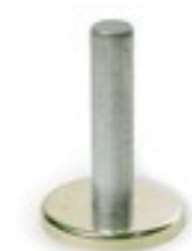
Base magnetica per installazioni veicolari

Pur essendo stata concepita per impieghi rapidi e di breve durata (lettura e scarico diretto dei dati), in caso di installazioni semipermanenti è possibile dotare la WD2550 di telemetria via GSM